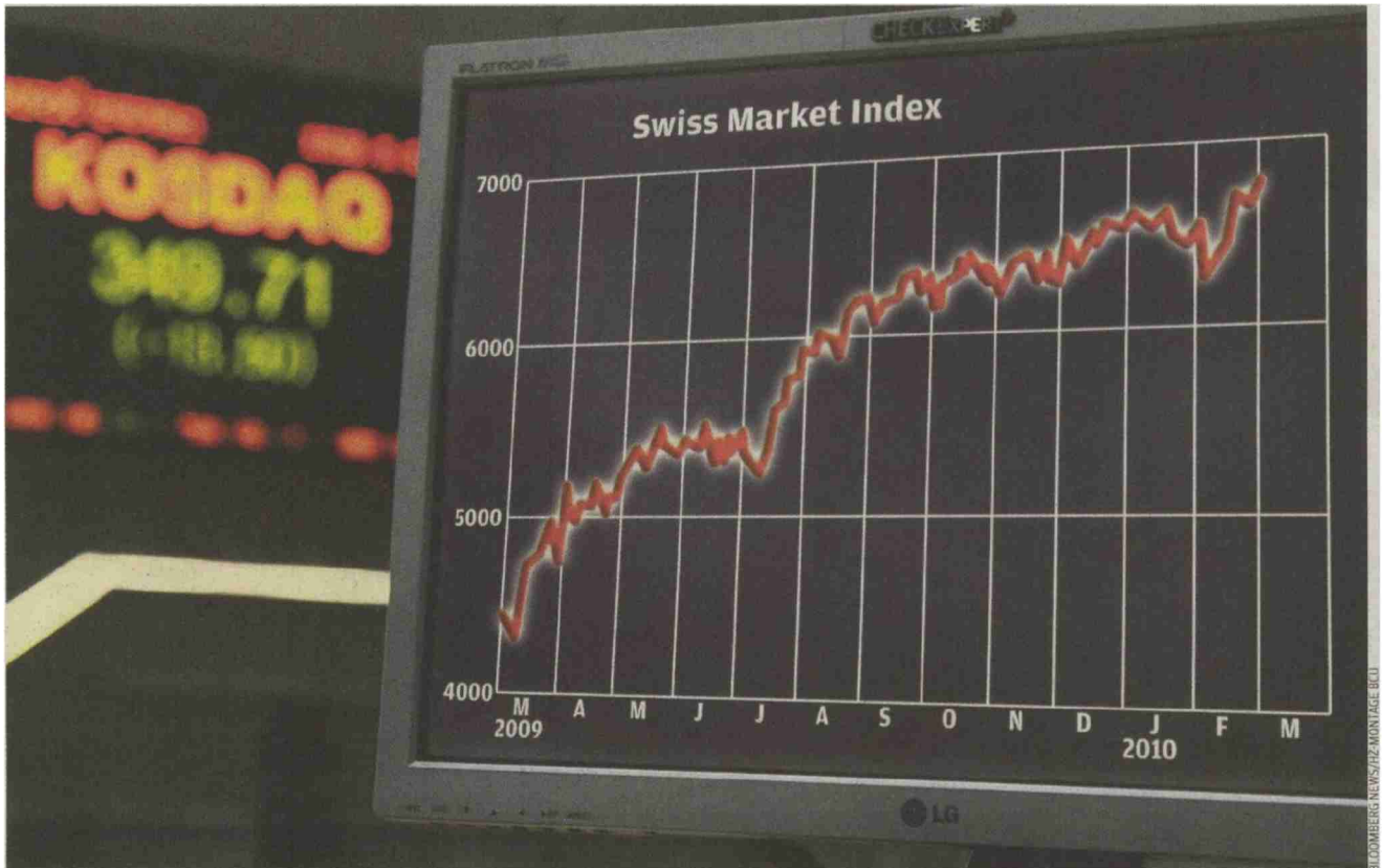
Das beherzte Eingreifen der Notenbanken hat seine Wirkung nicht verfehlt: Seit März 2009 hat der SMI über 2300 Punkte gutgemacht.

Themen-Nr.: 220.62 Abo-Nr.: 1002054 Seite: 21 Fläche: 59'532 mm 2